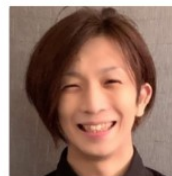
スターキー補聴器スタッフ