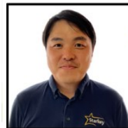
スターキー補聴器スタッフ